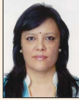
आशा अधिकारी नायब महाप्रबन्धक